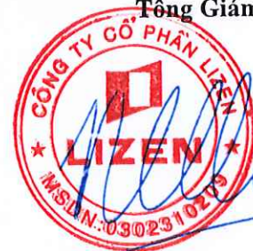
CAO NGỌC PHƯƠNG